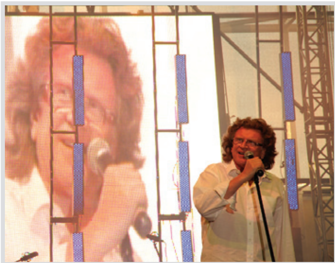
▲ Koncert Wodeckiego poruszył wszystkich do zabawy