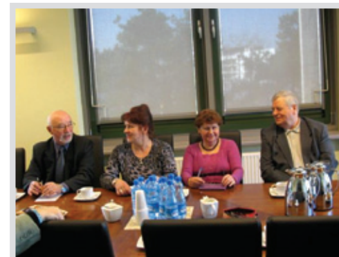
▲ Rada rozpoczęła swoją działalność od analizy potrzeb i oczekiwań legionowskich seniorów

W kwietniu 2010 r. rozdano około 400 ankiet seniorom zrzeszonym w różnych organizacjach pozarządowych, jak i nie zaangażowanych w żadną działalność. Zwrócono 286 ankiet, głównie wypełnionych przez mieszkanki naszego miasta. Po analizie odpowiedzi na 11 pytań można stwierdzić, że seniorzy w Legionowie mocno wierzą, że starsi ludzie mogą mieć wpływ na życie społeczności lokalnej, ale brakuje im odwagi i motywacji do działania. Obawiają się ujawnienia słabości. Inicjatywy podejmowane przez organizacje pozarządowe cieszą się uznaniem seniorów i są im potrzebne.