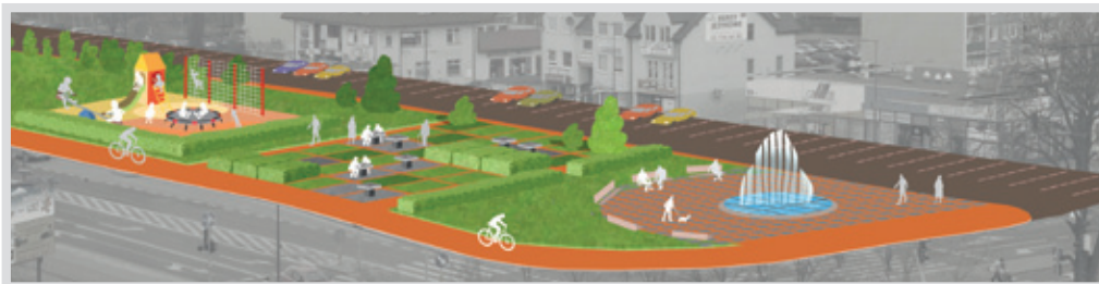
▲ Czy przy Sobieskiego będzie Legionowski Central Park zadecydują mieszkańcy

„Mieszkańcy nie tylko wypowiedzieli się na temat przenosin, ale również sygnalizowali problemy i wnosili konstruktywne uwagi”, które jak zapewnia pani radna, na pewno wykorzysta podczas rozmów z odpowiednimi instytucjami. Temat targowiska ma zostać podjęty na szerszym forum najwcześniej we wrześniu.