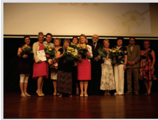
▲ Tegoroczni laureaci konkursu „Wychowawca roku”

Cele konkursu to wspieranie i promowanie wychowawczej roli nauczyciela oraz kształtowanie dobrych relacji pomiędzy uczniem a nauczycielem. Lista cech, którymi powinien