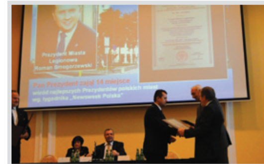
▲ Uroczystość wręczenia certyfikatu