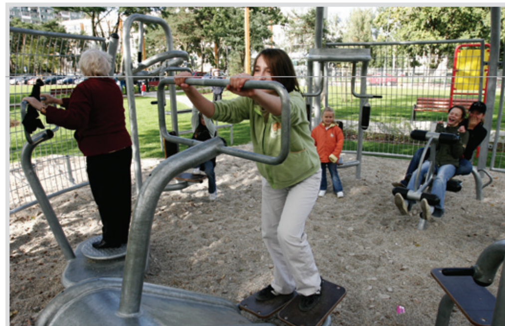
▲ Tegoroczna oferta lata w mieście przewiduje zajęcia nawet dla najbardziej wymagających mieszkańców

Najwięcej atrakcji przygotował Miejski Ośrodek Sportu i Rekreacji, który zaprasza na wszystkie swoje obiekty – Stadion Miejski, boiska ze sztuczną nawierzchnią oraz do Areny. W imię hasła „dla każdego coś dobrego” MOSiR proponuje grę w piłkę nożną, plażową piłkę siatkową, koszykówkę uliczną, tenis stołowy, jazdę na rowerze, nordic walking oraz gry i zabawy ruchowe. Na Stadionie Miejskim oraz boisku przy