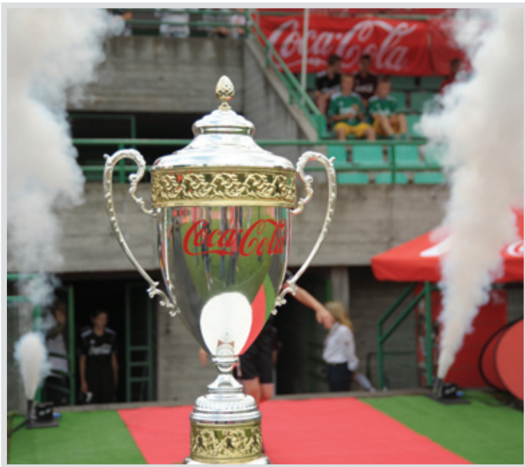
▲ Młodzież z Chocianowa i Warszawy stanęła na najwyższym podium

Tym razem finał tej prestiżowej imprezy odbył się w naszym mieście, a rozgrywki zbiegły się z obchodami Dni Legionowa. Tytuły mistrzowskie wywalczyli: w kategorii dziewcząt – zawodniczki z Gimnazjum w Chocianowie (województwo dolnośląskie), a w kategorii chłopców – reprezentanci Gimnazjum Nr 48 w Warszawie. Wyłoniono także dziesięciu laureatów