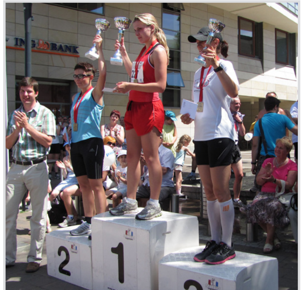
▲ Z roku na rok „Dycha” cieszy się coraz większą popularnością

Wszyscy uczestnicy biegów, a było ich łącznie z mieszkańcami powiatu ponad 500 osób, otrzymali koszulki oraz pamiątkowe medale. Najlepsi w klasyfikacji generalnej oraz najlepszy zawodnik i zawodniczka z Legionowa otrzymali nagrody. Kolejna Dycha już za rok.