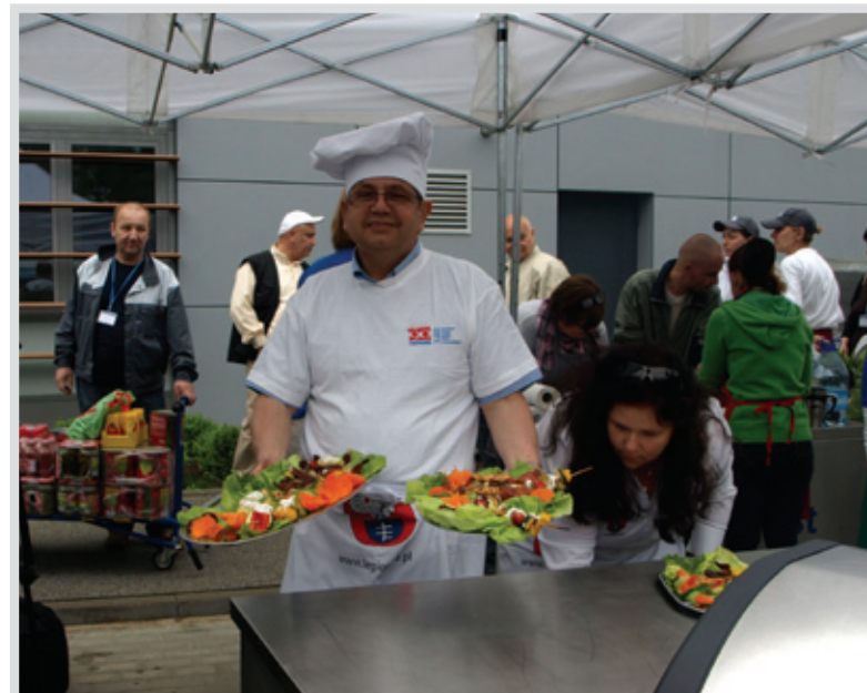
▲ Uczestnicy konkursu prześcigali się w pomysłach na przygotowanie ryby

Na ruszcie znalazły się liny i karasie, a podawano je w przeróżnych kombinacjach. W grillowych zmaganiach udział wzięły drużyny mieszkańców, dziennikarzy oraz samorządowców. Nad prawidłowością przebiegu