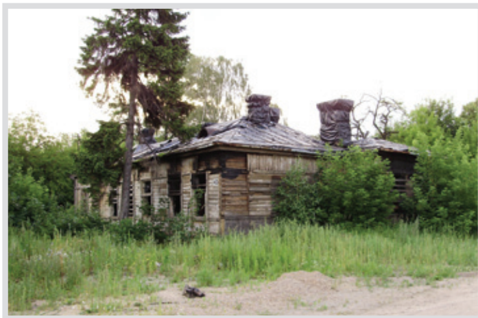
▲ Kasyno po liftingu zyska nie tylko nowy wygląd, ale i inne otoczenie

Rewitalizacja kasyna przebiegać będzie w kilku etapach: pierwszym jest rozbiórka zabytkowego obiektu, cechowanie elementów i ich katalogowanie, a także wykonanie projektu odbudowy, uzgodnionego z konserwatorem zabytków. Kasyno rozbierane jest deska po desce, po czym przeniesione zostanie w nowe