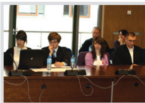
▲ Młodzież obraduje nad tolerancją

Obradom przysłuchiwali się władarze miasta, dyrektorzy i opiekunowie samorządów z legionowskich szkół. Młodzi mieszkańcy