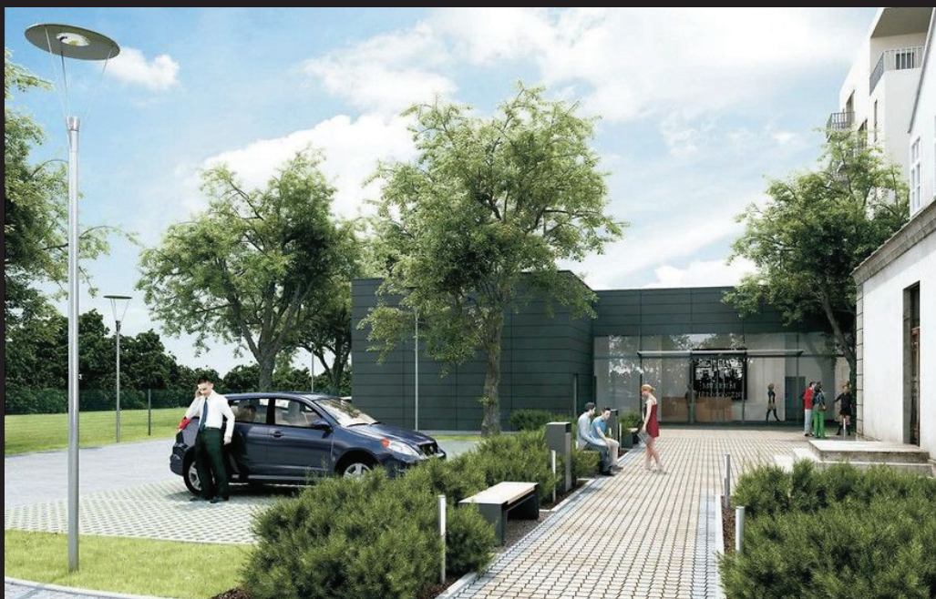
▲ Wizualizacja pawilonu wystawienniczego