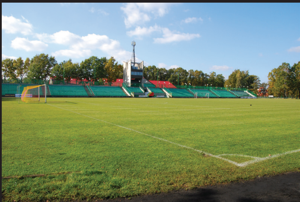
▲ Stadion po przebudowie zyska m. in. nową nawierzchnię